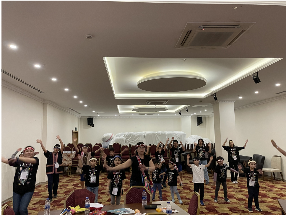
原住民文化編織與海洋之歌舞蹈