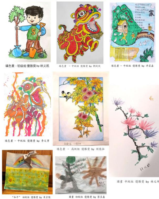
填色畫和自由創作的優秀作品 1