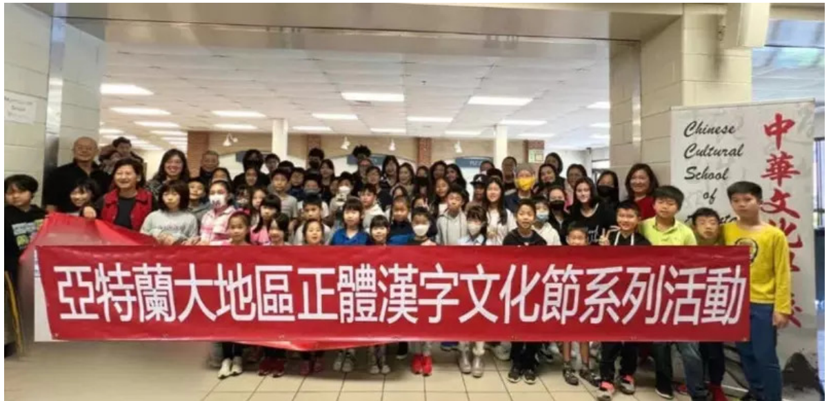
2022年中華文化學校漢字文化節參賽選手與教師和家長合照