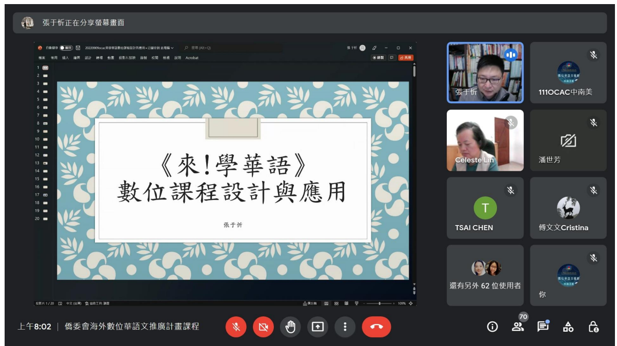
《來！學華語》數位課程設計與運用上課情形

承辦單位本次規劃了「MyCT」《來！學華語》口說練習課程教學運用、《學華語向前走》入門基礎正音教學課程設計、「全球華文網」幼兒趣味教學活動、《來！學華語》數位課程設計與運用等課程，從各個不同的面向提升中南美洲華語教師的數位教學能力。各門課程除運用《學華語向前走》、《來！學華語》教材、全球華文網與政府資源外，同時提供學員在實際的華語遠距課堂中能夠簡易上手、提升效率的教學工具，以滿足全球疫情及數位化的時代趨勢。