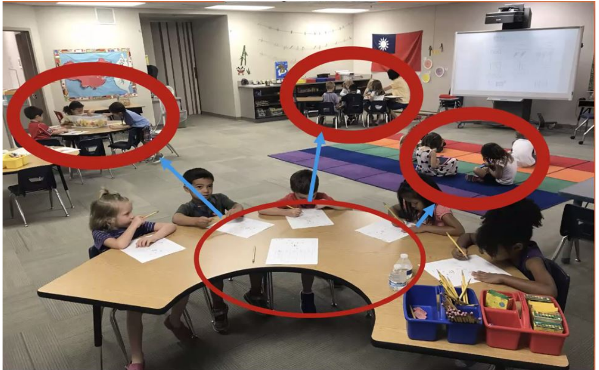
合作學習的實際演練