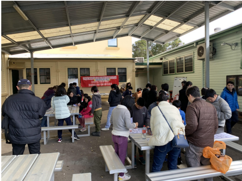
漢字闖關活動場景

正體漢字有豐富的文化根基，字型字義相容匹配有故事淵源、有如詩如畫的意境背景，更是歷史傳承的重要載體。雪梨臺灣學校30多年來堅持正體漢字教學就是堅持這樣的歷史文化價值，期許正體漢字的美、價值與文化意涵能在海外僑界持續發展下去、永生不息。