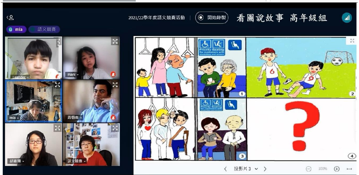
看圖說故事比賽 高年級組