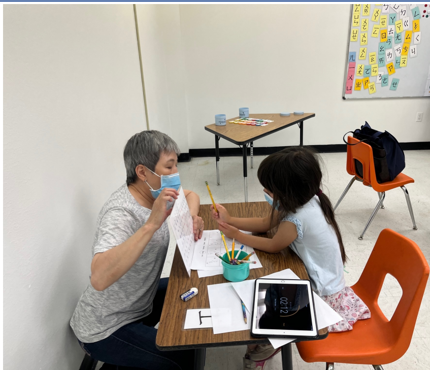
學藝競賽，注音組：玩遊戲複習發音及認字。