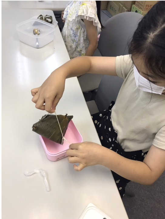
品嚐自己做的粽子