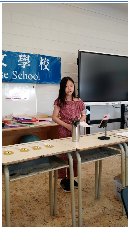
高年級組-我最喜歡做的事