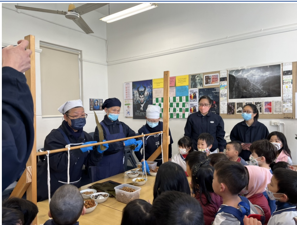
慈濟志工示範給學生看如何包粽子