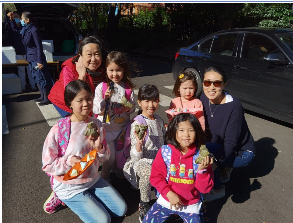
學生拿到溫暖粽子都很開心