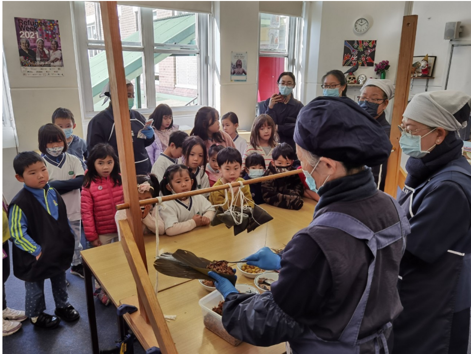
學生聚精會神觀看如何包粽子