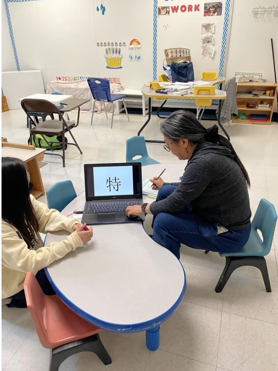
高年級學生認字比賽