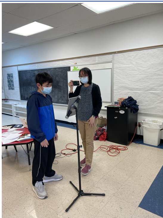
老師錄影學生的認字比賽