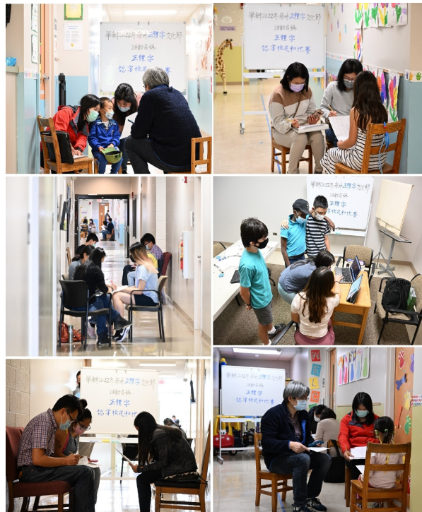
檢定比賽計時進行中，每一位學生在評審面前讀出試題上的字詞