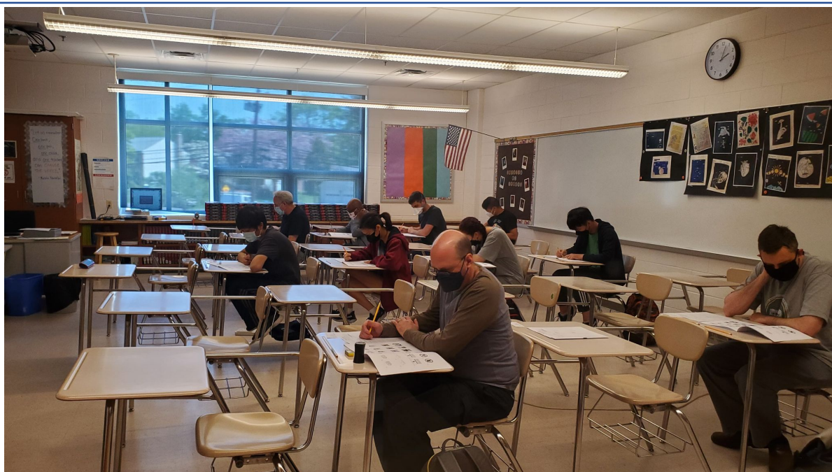
臺灣學校華語文中心學員進行華測