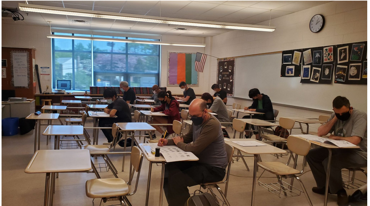
臺灣學校華語文中心學員進行華測