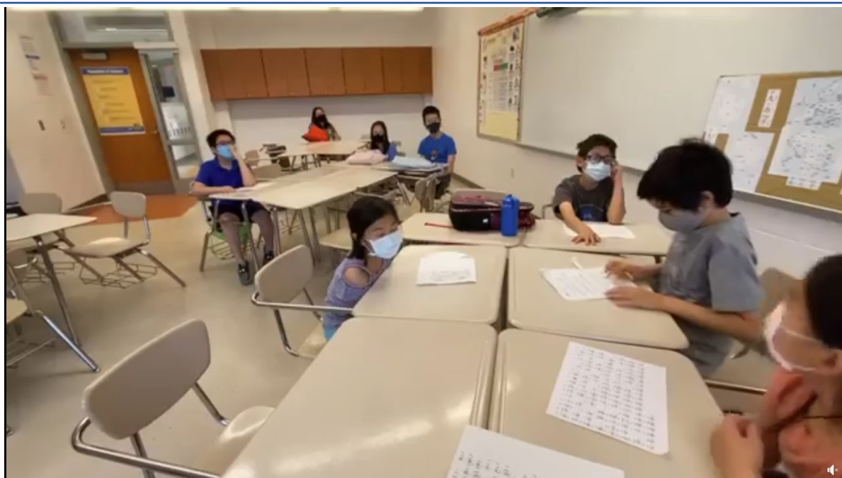
華文介紹七大洲和五大洋