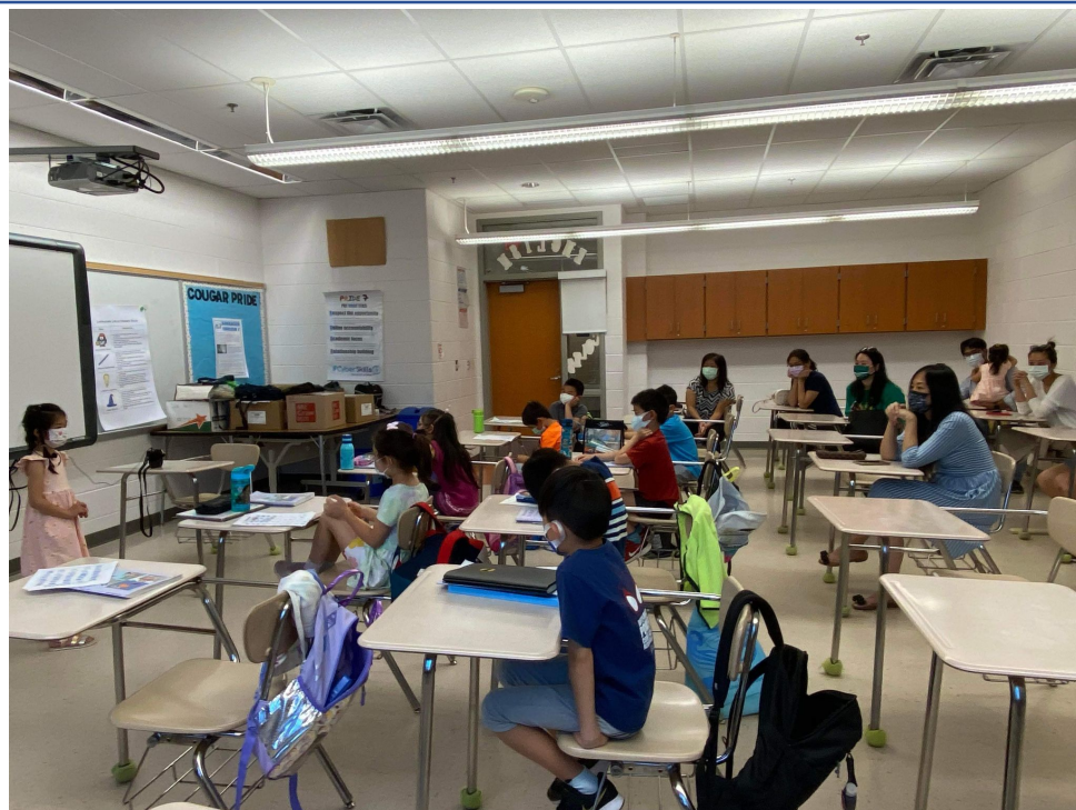
小班組進行「自我介紹」