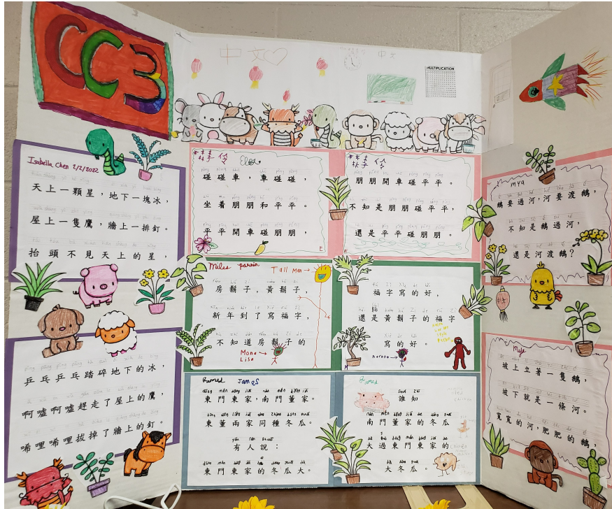
三年級班正體漢字及拼音繞口令