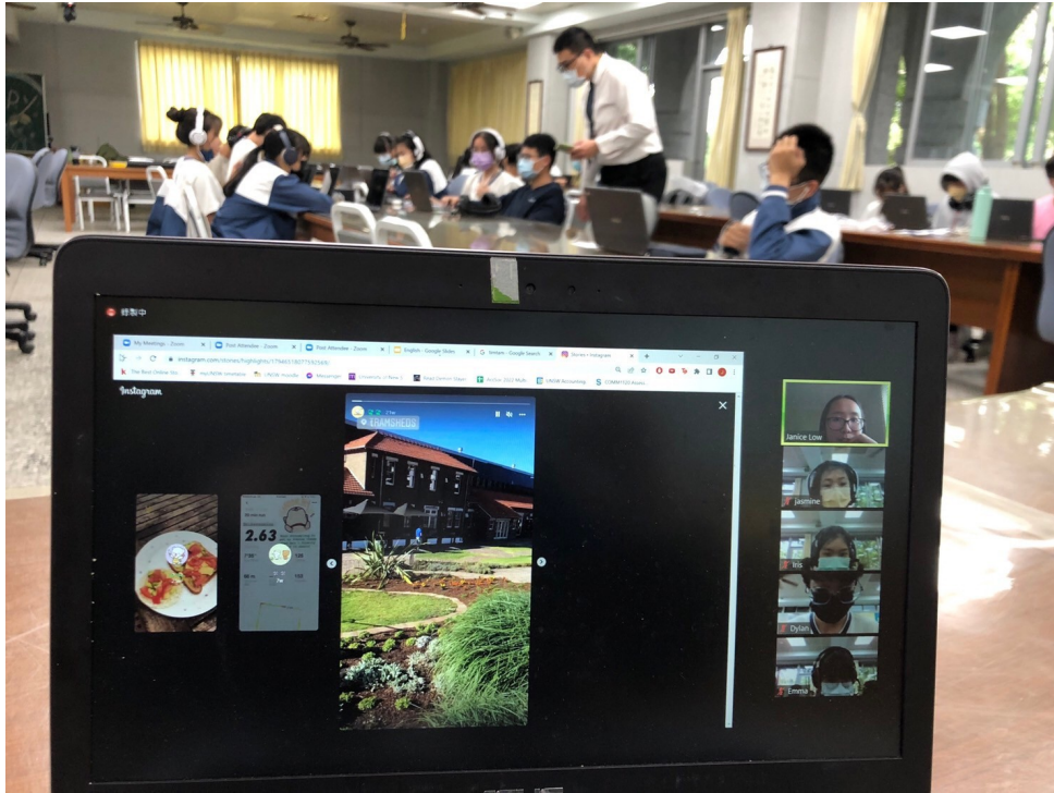
慈大附中雲端教室交流現場