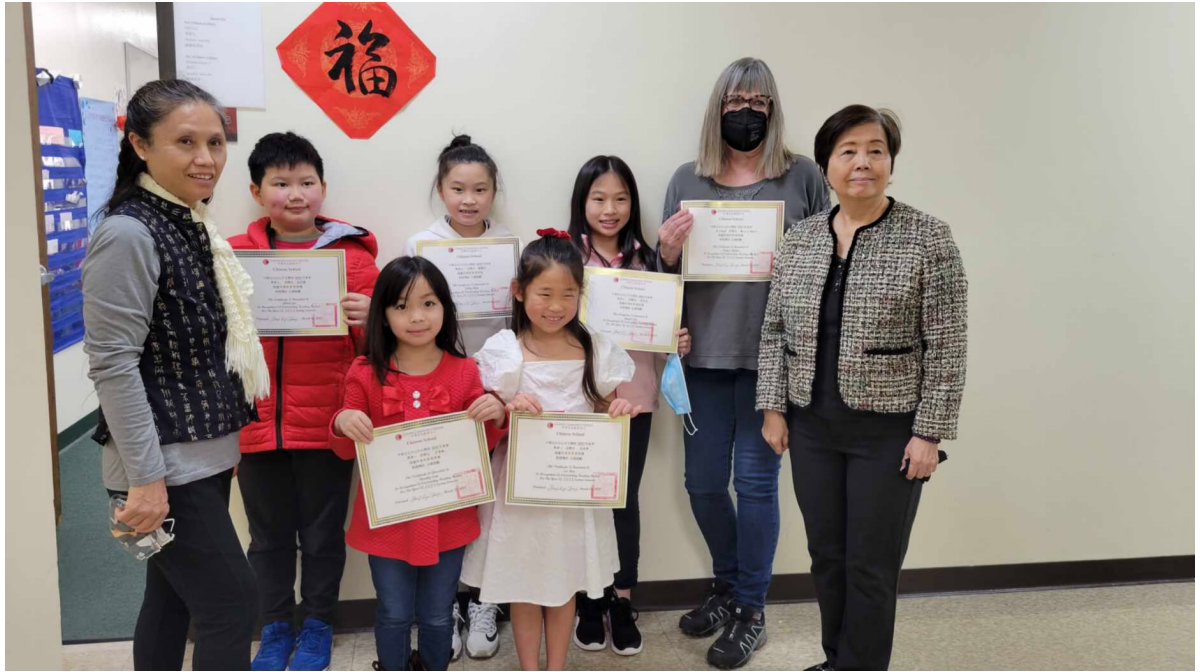
得獎學生和老師合影