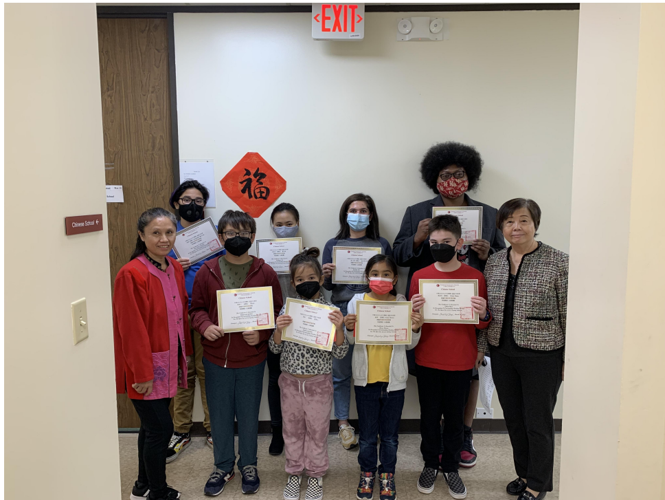
得獎學生和老師合影