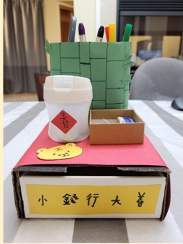
第一名 四年誠班 李正之