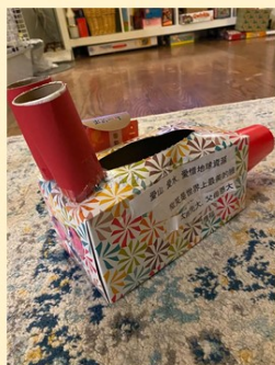
第一名 幼小誠班 黃莘昕