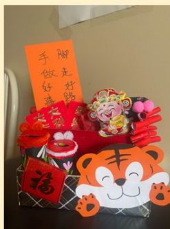
第一名 幼大誠班 鄭允和