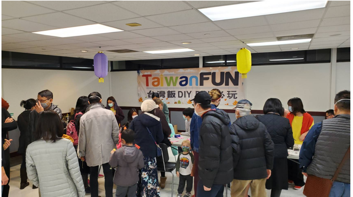
在地民眾體驗文化攤位