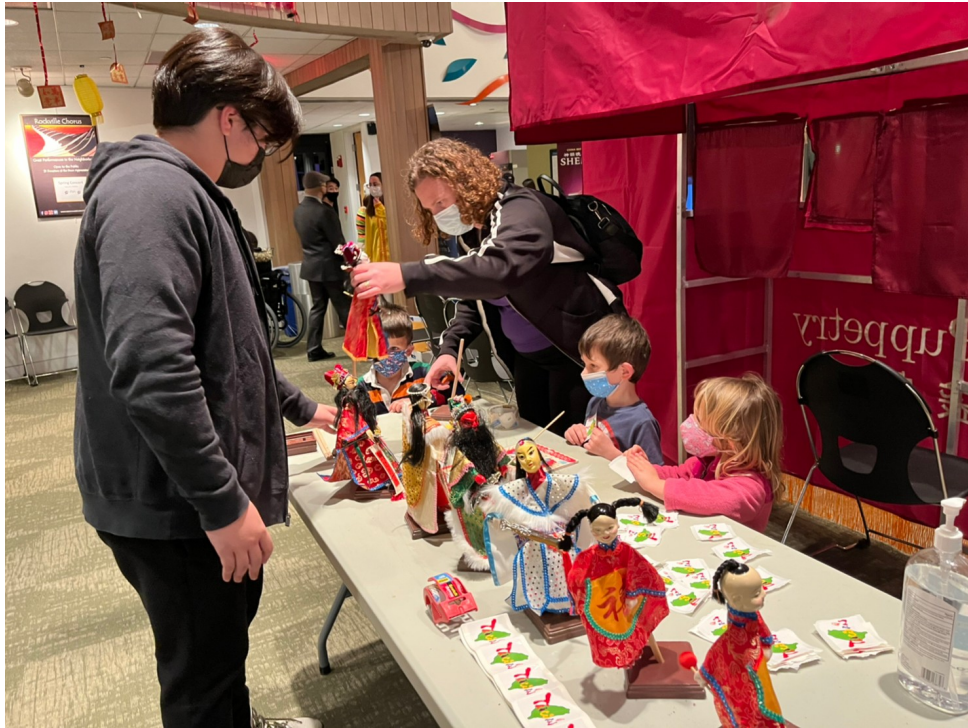
在地民眾體驗臺灣布袋戲