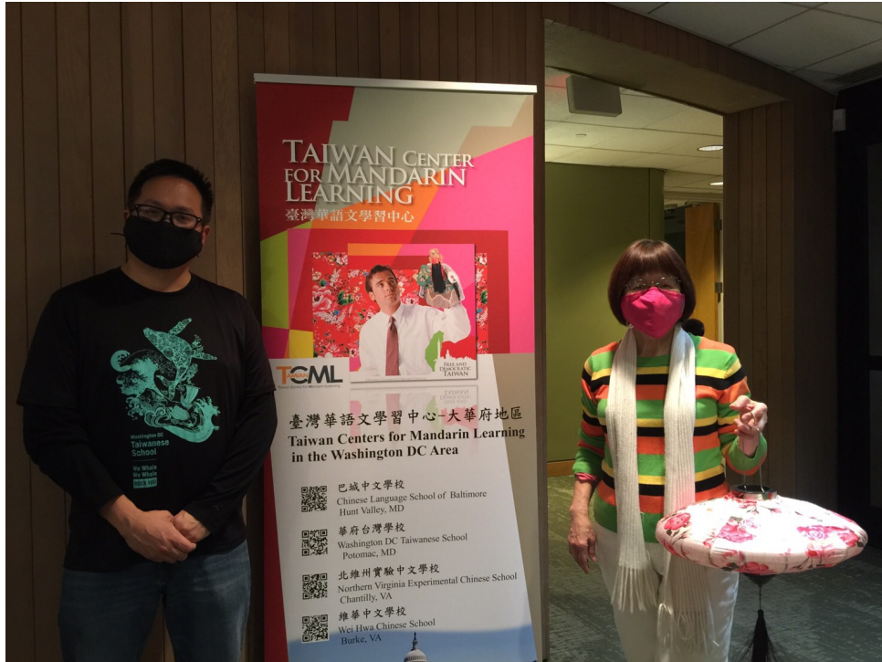
臺灣學校校長, 老師和華語文中心 banner 合照留念