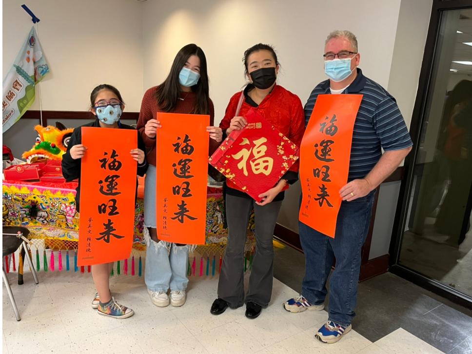
北維州實驗中文學校校長全家福