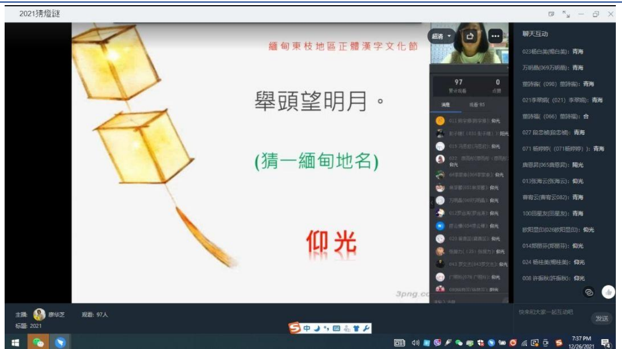
東枝興華學校猜燈謎活動內容多元，本圖為猜地名