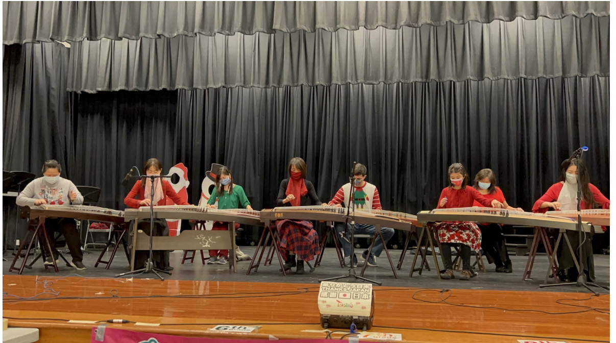
古箏團隊的琴聲相伴