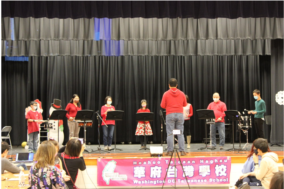
「臺灣學校打擊樂團」表演