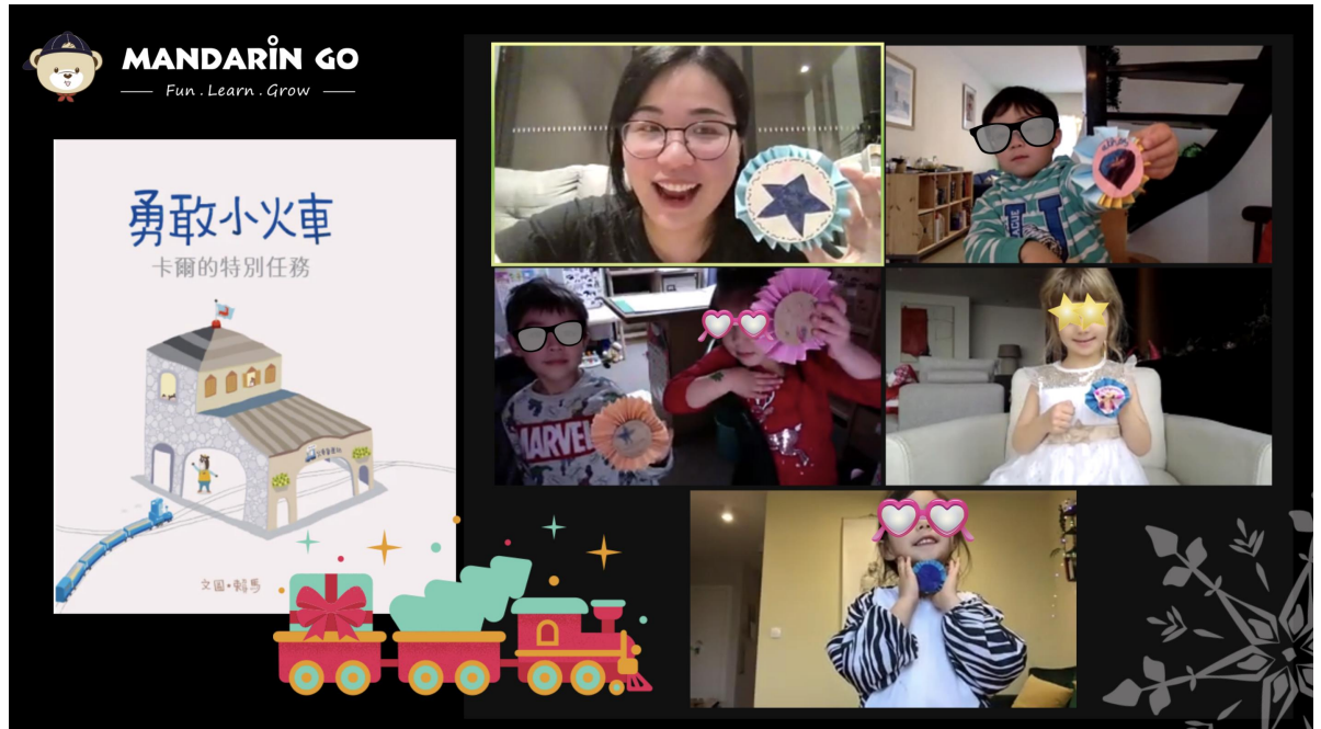
《勇敢小火車》繪本故事 - 勇敢勳章