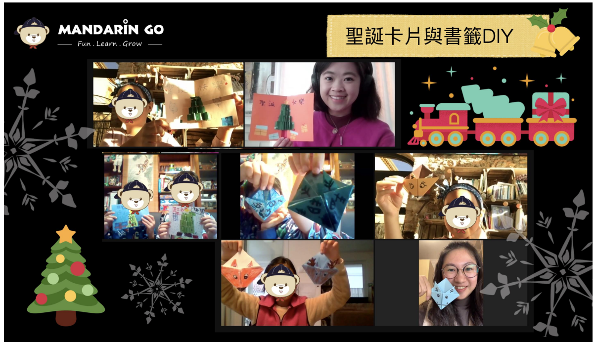
立體聖誕卡片製作與麋鹿書籤製作