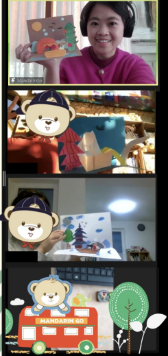
《楓橋夜泊》唐詩賞析與立體作品