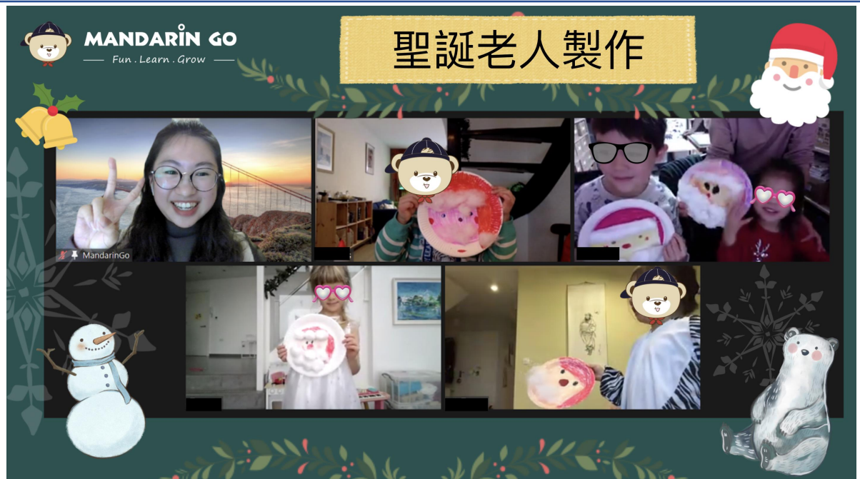
聖誕節的由來與活動 - 聖誕老人