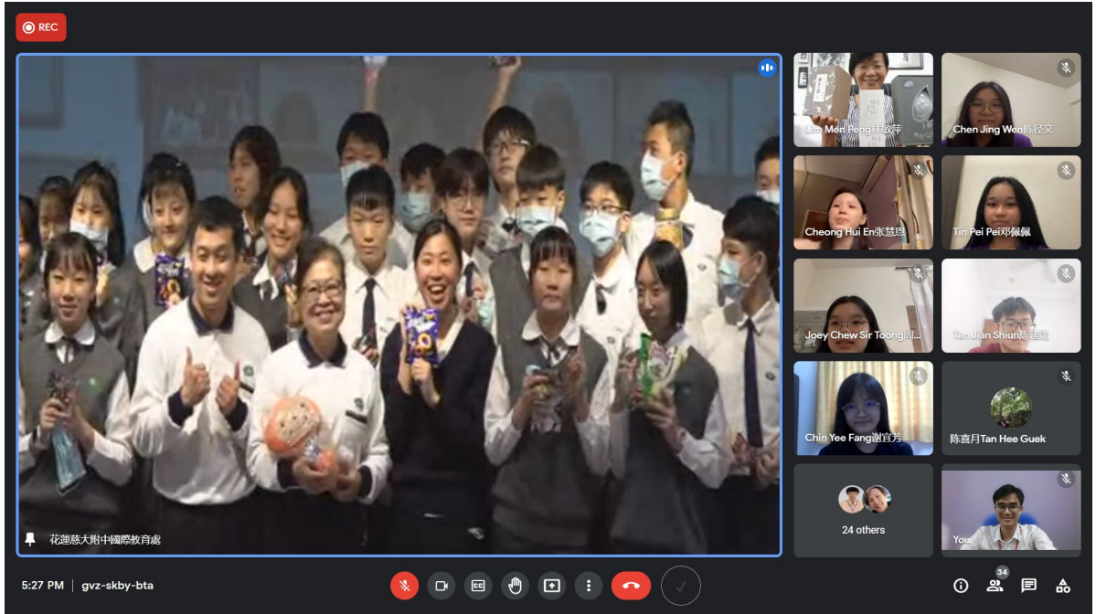
來張大合照~ (2021. 11. 16)