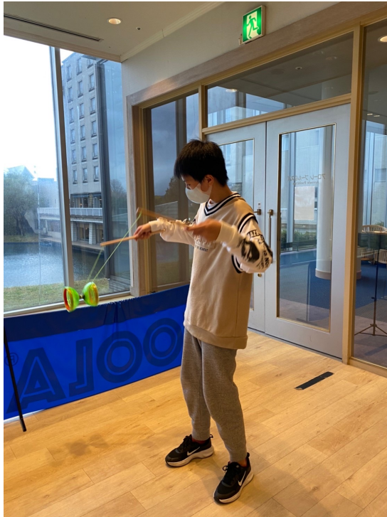
充滿興趣地挑戰著僑委會所提供的扯鈴。

整天的活動不僅再度提高了小朋友們的華語能力，樂趣十足的遊戲也提高了學習動力，全員皆滿載而歸！