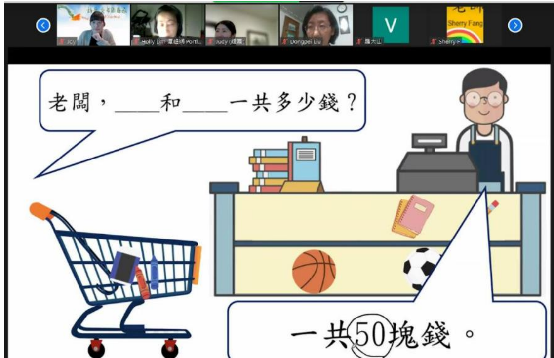
華語向前走第一冊範例