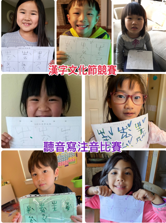
2021-Q4 小小班. JPG