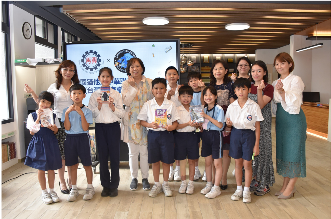
北市再興小學師生感謝猶他州中華聯誼會贈送優良叢書