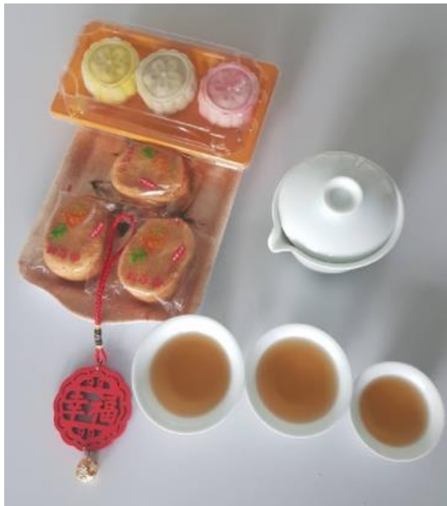
與老師舉行中秋節茶會

學生們從這些活動中，學習到中秋的文化意涵，也感受到過中秋節的歡樂氣氛。學生投入活動的熱情及伴隨的笑聲，應該是本次各班活動成功的最佳指標。