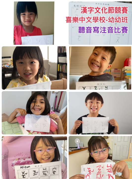
2021-Q2 幼幼班1. jpg