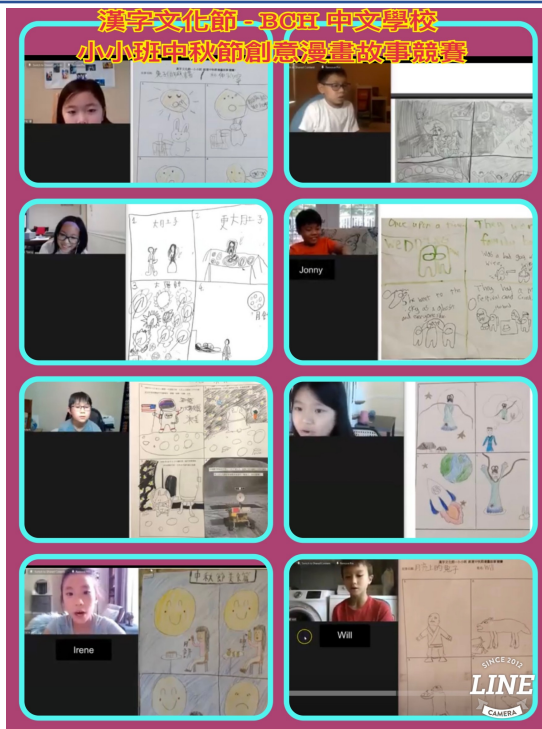
2021-Q3 小小班1. jpg