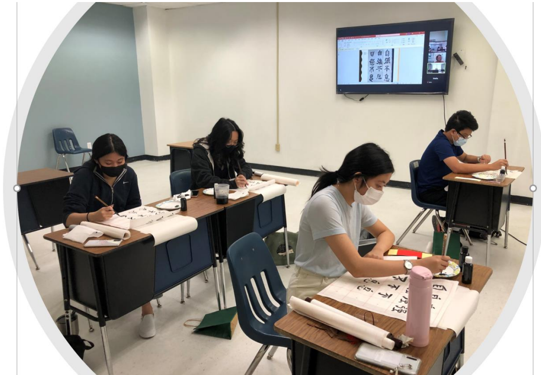
自創線上和實體混合教學