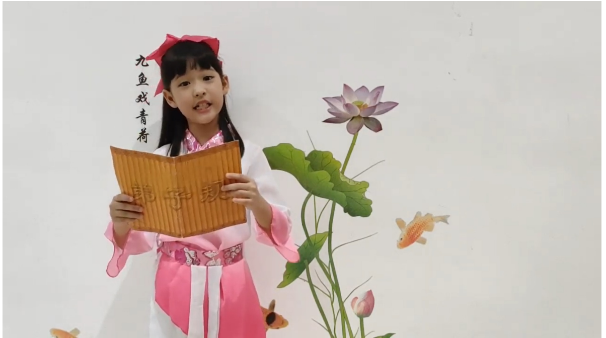
弟子規朗讀比賽低年級組第三名同學猶如書畫中走出來的古代學生