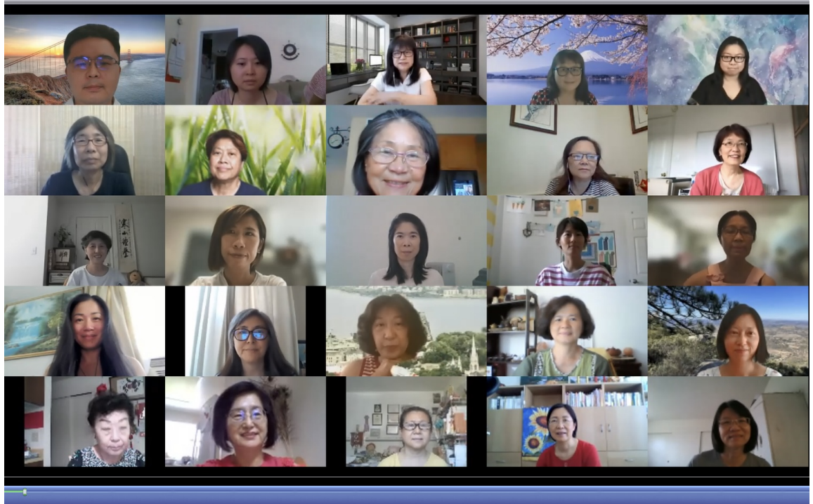
老師網路合照之一。