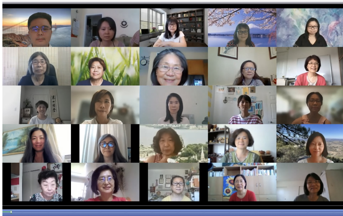
老師網路合照之一。