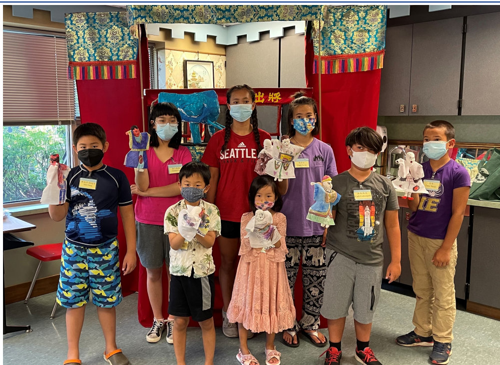
學員自製布袋戲偶。