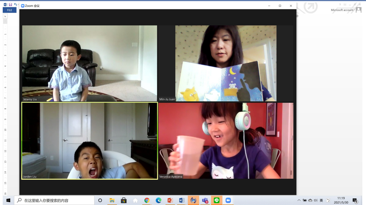
中文夏令營老師說故事時間