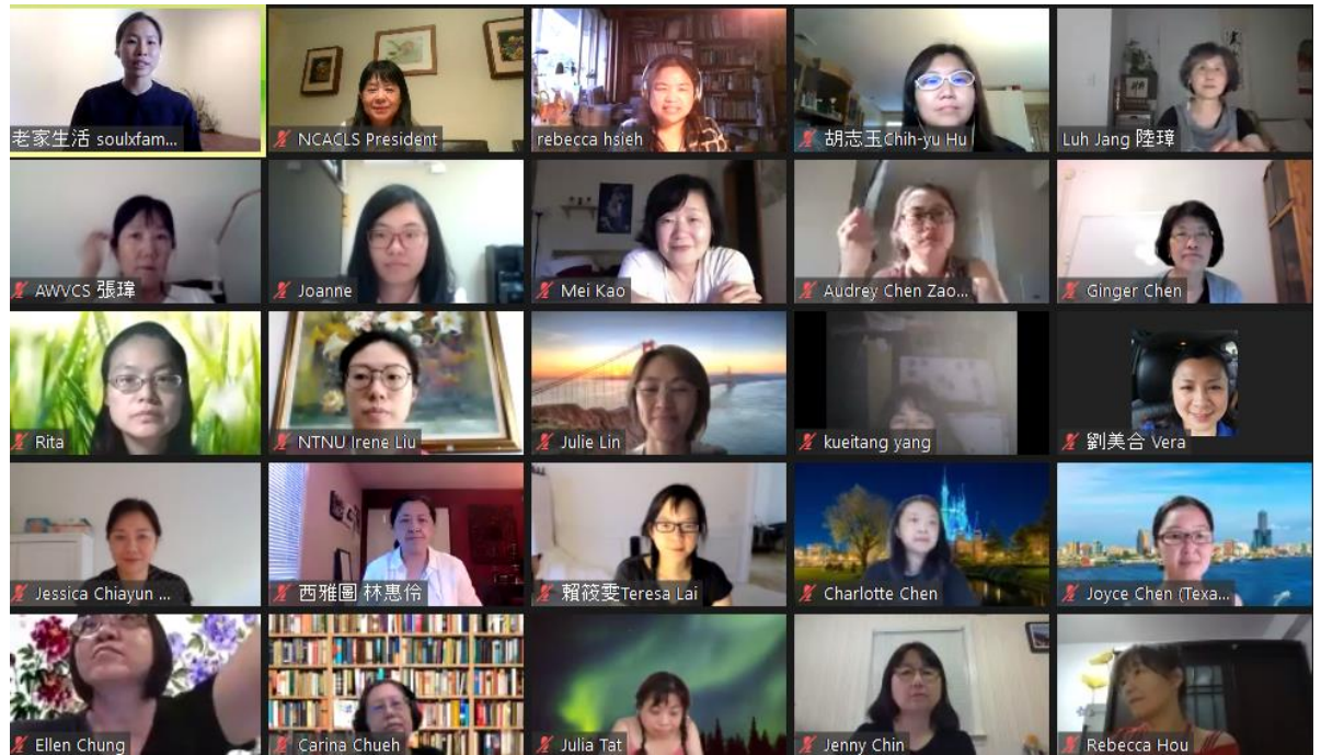
參與培訓的老師們(三)