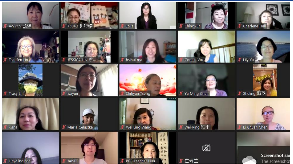
參與培訓的老師們(二)