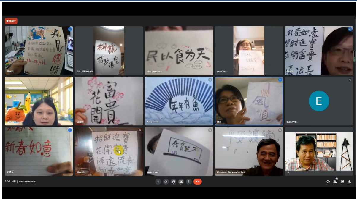
漢字文化節系列-漢字揮毫研習活動