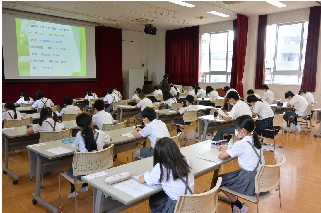
作文比賽參賽全體