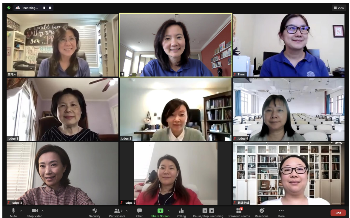
辛苦又開心的評審和工作人員們

5/16 下午2:00 決賽結果出爐，舉行了盛大成功的線上頒獎典禮，得獎學生們除了接受表揚，並將於近期內收到本會郵寄的獎狀及禮卡，典禮中每組第一名得獎學生於線上再次演繹說故事及簡報之得獎內容作品，與會的貴賓和各校代表紛紛稱讚不已，為此次本會舉辦學生線上比賽的成功創舉給予高度的肯定，學生和家長們也對中文學習能有不同方式的呈現成果，表示非常有成就感，並期望本會今後繼續舉辦此類比賽。