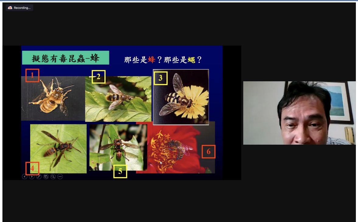
擬態 (mimicry) 的昆蟲