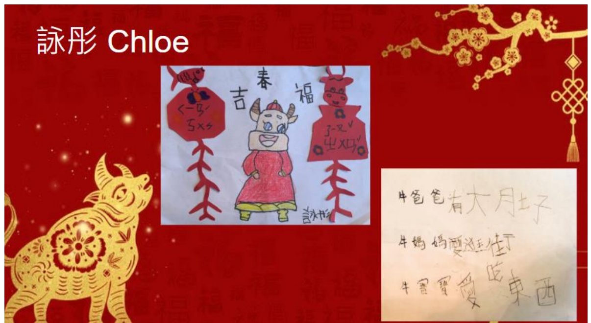
大班孩子創作可愛的畫牛話牛

今年是北卡洛麗中文學校首度在正體漢字文化比賽上使用數位創作，全校師生對此新模式覺得很新鮮、也很喜歡。本次壁報比賽經過激烈競爭，評選出優等、優選、和佳作等名次。校方將頒贈電子禮卡給獲獎班級，以示鼓勵。