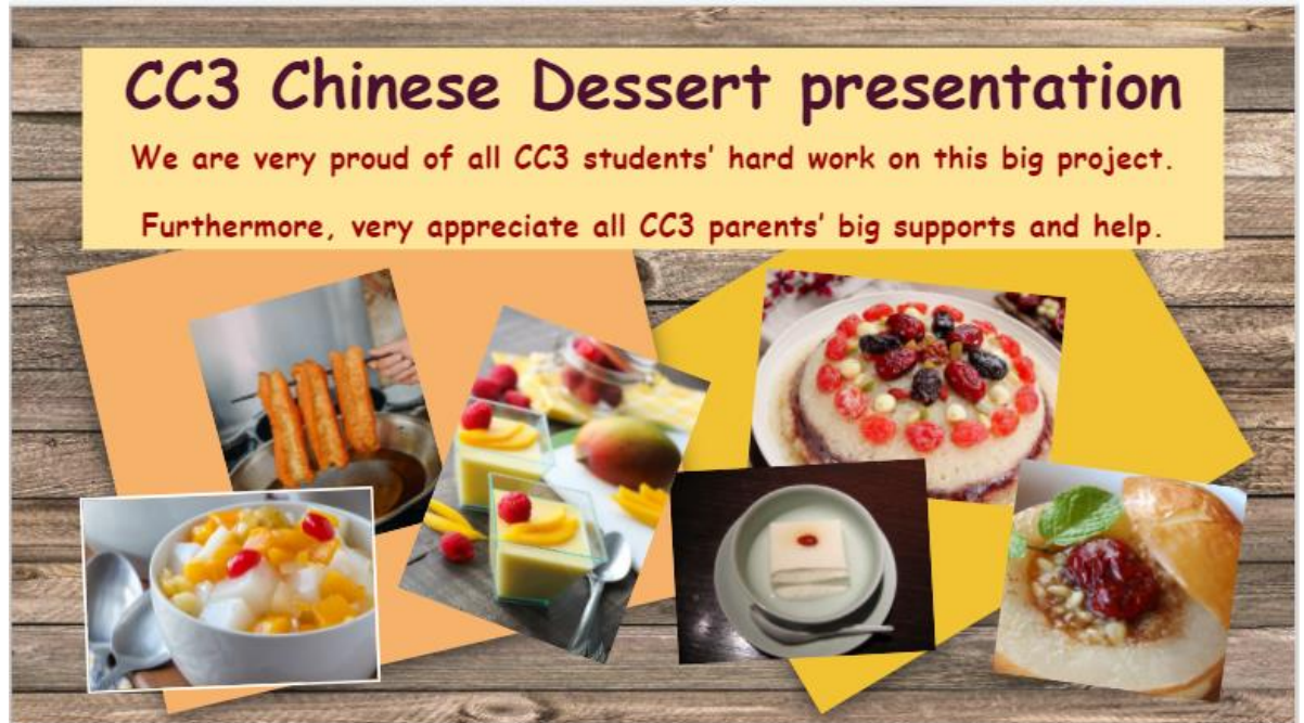
6年級的參賽作品—臺灣甜點私房食譜