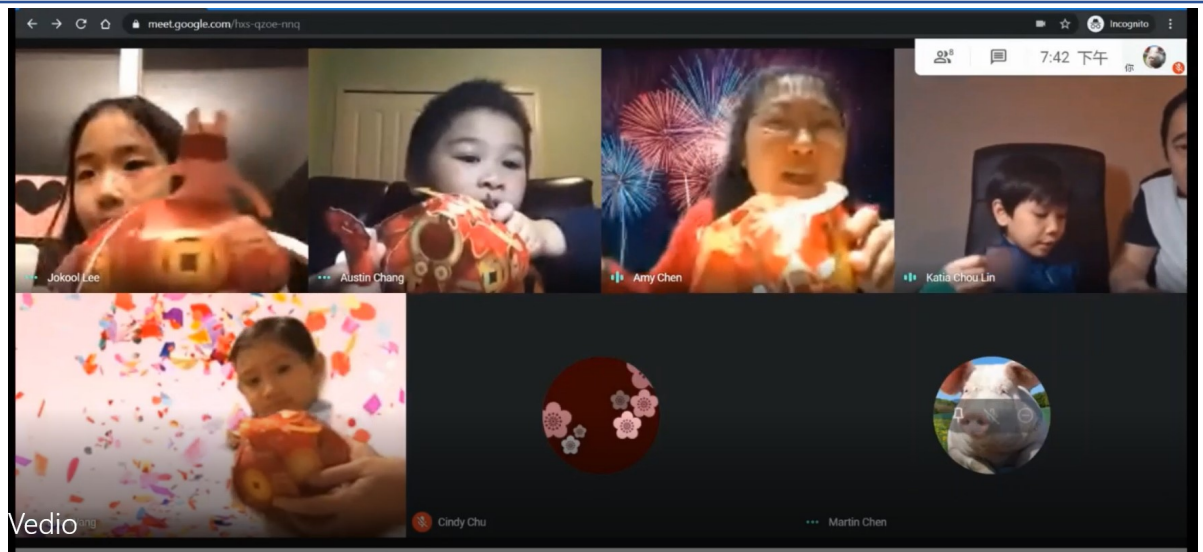
2021 南密中文學校慶祝春節活動—提燈籠慶新年