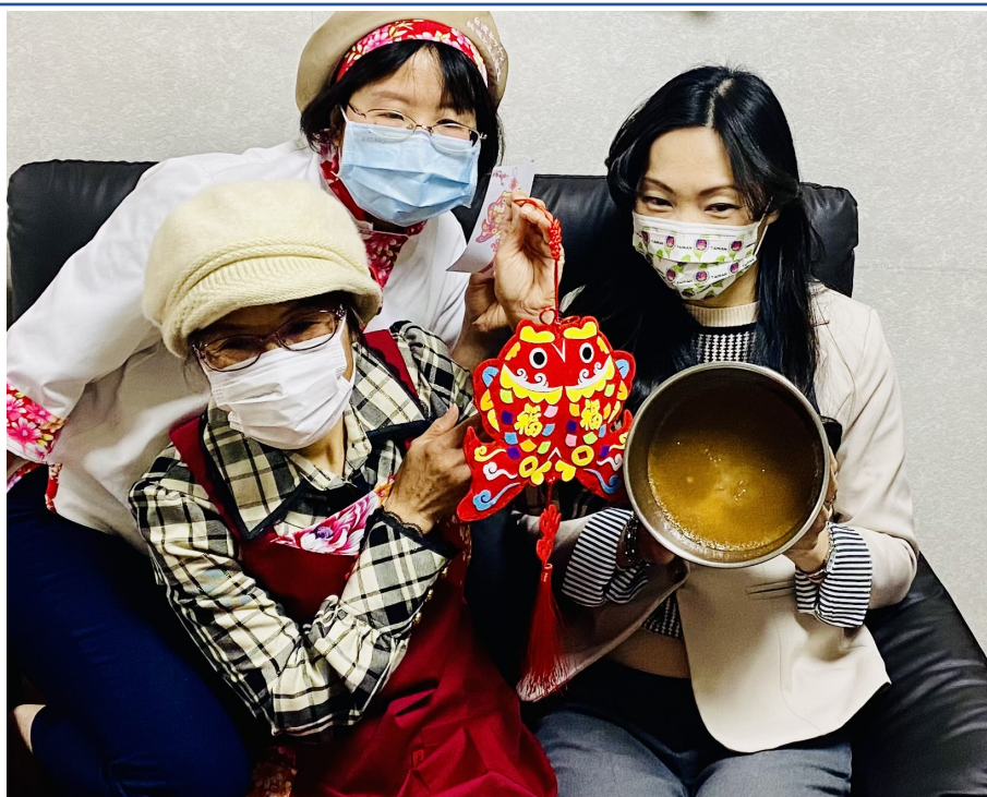
春節雙魚吊飾及年糕完成囉