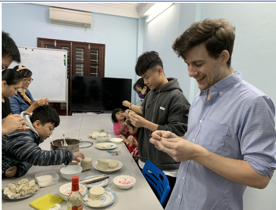
臺商朋友及其子女一同共襄盛舉