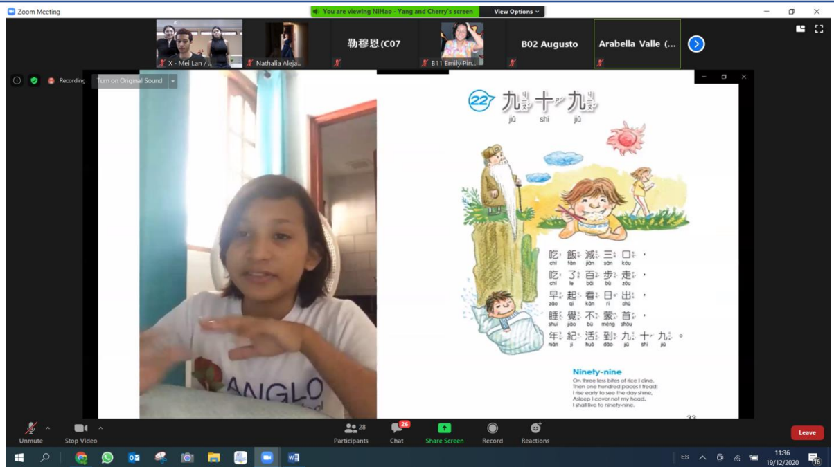
小孩班朗讀比賽_九十九