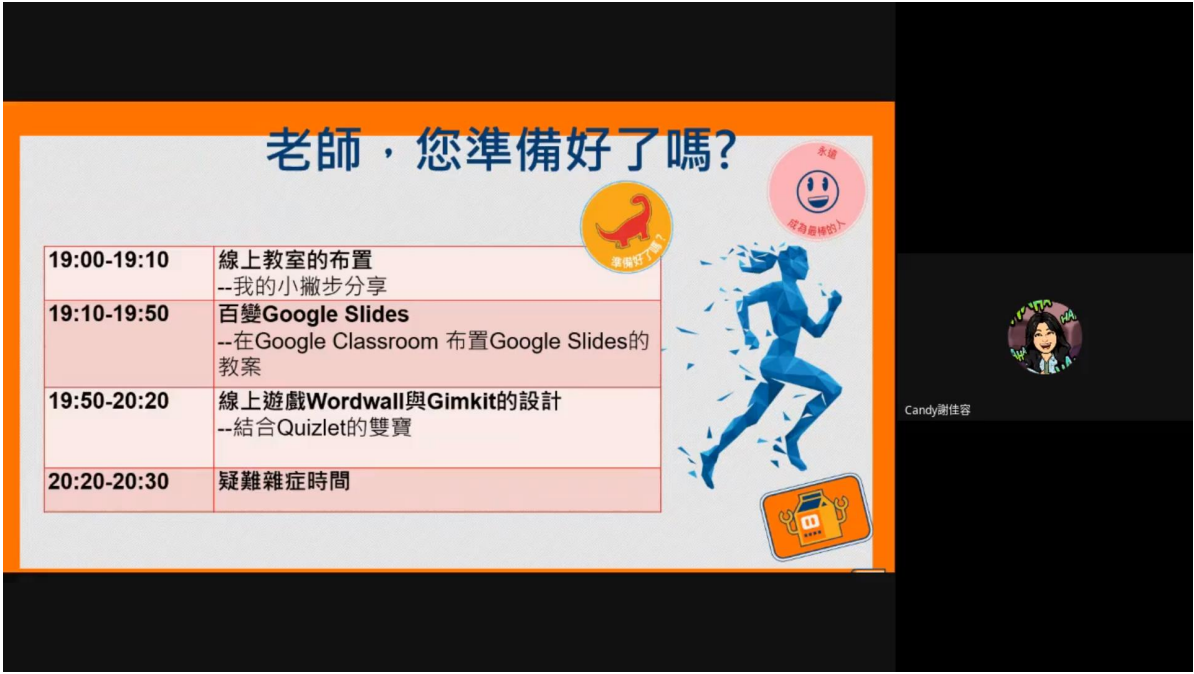
加東中文學校聯合會舉辦第2次線上《學華語向前走》教案分享會之課程表。