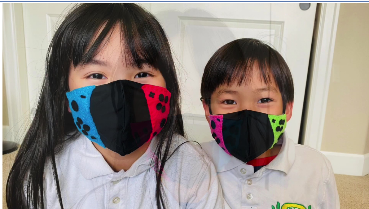
利用家中剩餘布料做出熱門的生活用品—口罩