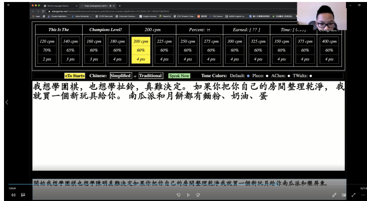
高級正規語文班 - 線上速讀比賽第2名學生的比賽畫面