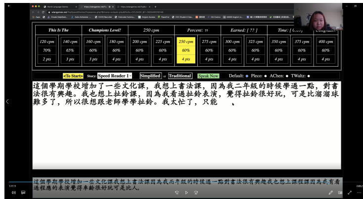
高級正規語文班 - 線上速讀比賽第3名學生的比賽畫面