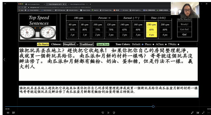
高級正規語文班 - 線上速讀比賽第1名學生的比賽畫面