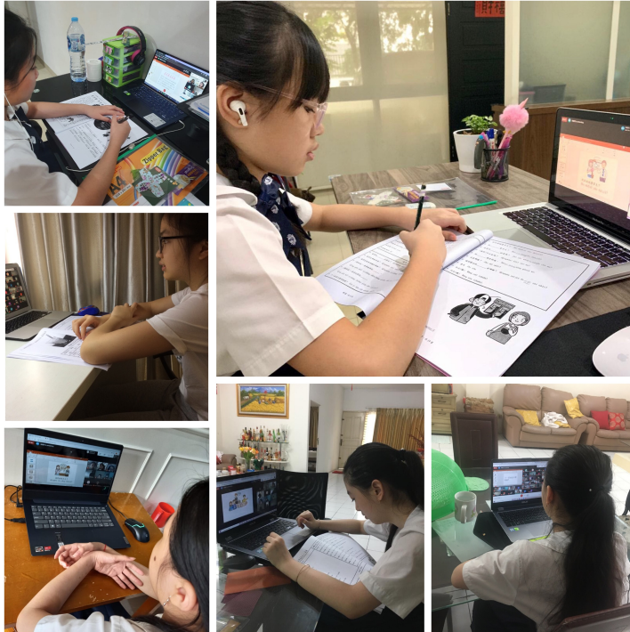
學生線上教學情形。