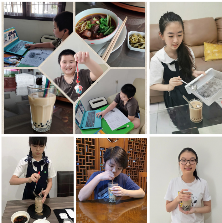
學生動手製作黑糖珍珠奶茶。