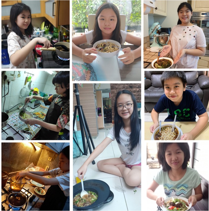
學生自己動手煮紅燒牛肉麵。