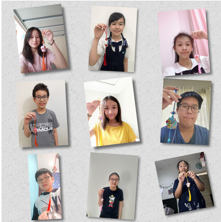
學生手作天燈，祈福一切平安。