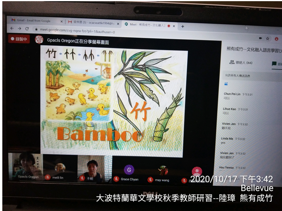
華語課本以「竹」為主題