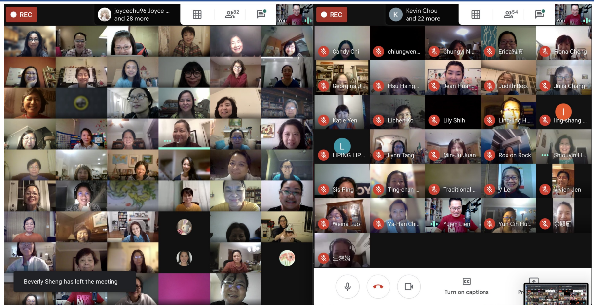
兩間教室部分同步上課學生