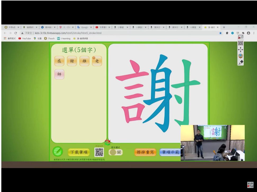
學生最佳的學習網站